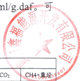
表 4 可采煤层瓦斯成分及含量统计表

瓦斯含量：甲烷(CH 4 )含量为 3.05~11.48ml/g.daf；氮(N 2 )含量 1.23~10.65ml/g.daf，重烃含量为 0.02~0.20 ml/g.daf，二氧化碳(CO 2 )含量为 0.05~0.25 ml/g.daf，可燃气体含量为 3.09~11.52 ml/g.daf。可采煤层瓦斯成分及含量统计见表 4。